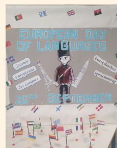
Escola Egas Moniz