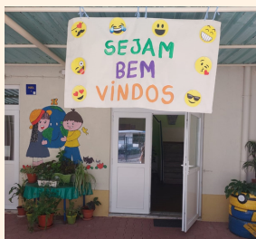
Jl EB nº2 de Massamá