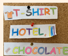
Escolas do 1º ciclo