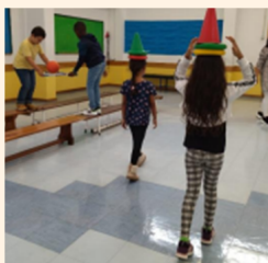
EB Casal da Barota

"Sejam todos bem vindos À Escola que era amarela É uma escola simpática Não há melhor que ela