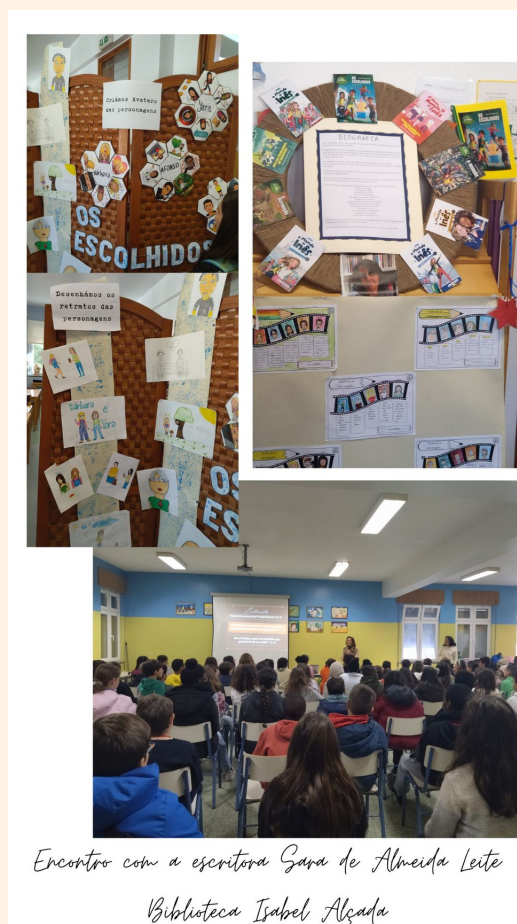
Encontro com a escritora Sara de Almeida Leite Biblioteca Isabel Alçada

Foi um dia em cheio que certamente contribuiu para consolidar o gosto pela leitura e escrita dos nossos alunos. A equipa da Biblioteca Escolar Isabel Alçada agradece o contributo de todos os envolvidos para o sucesso desta atividade.